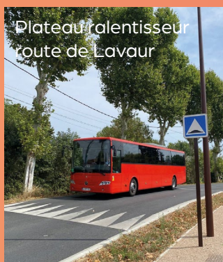
Plateau ralentisseur route de Lavaur

La ville prend en compte vos remontées pour investir dans des équipements qui permettent à tous les usagers de la route de se déplacer en confiance.