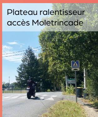
Plateau ralentisseur accès Moletrincade