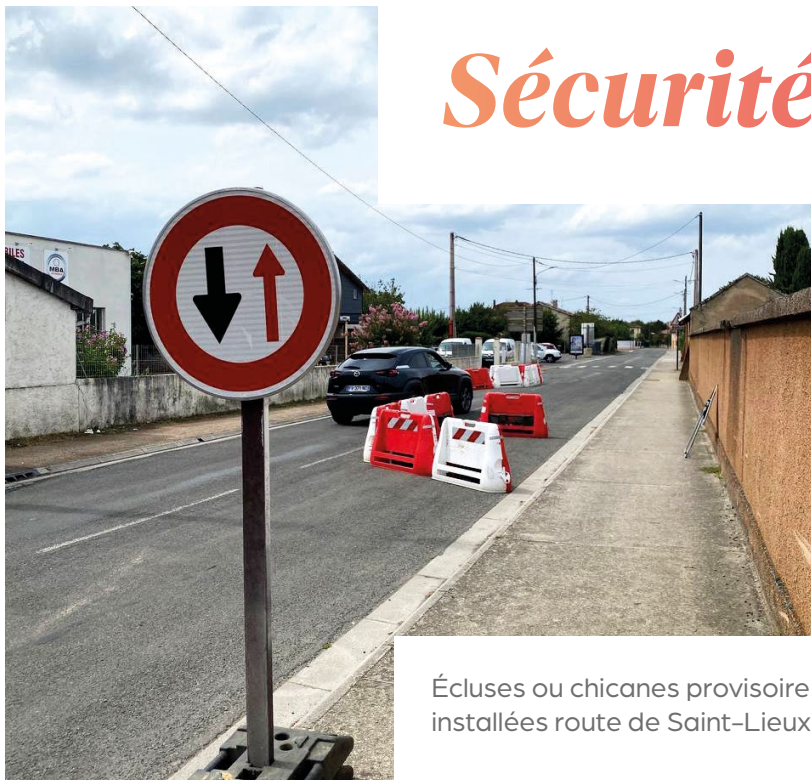
Écluses ou chicanes provisoires installées route de Saint-Lieux.