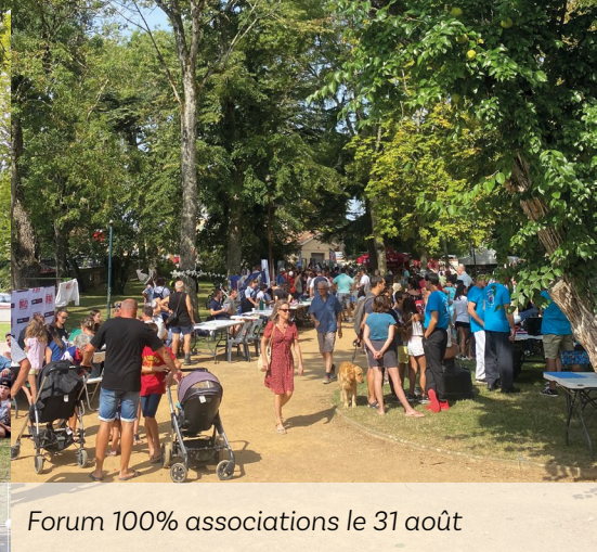
Forum 100% associations le 31 août