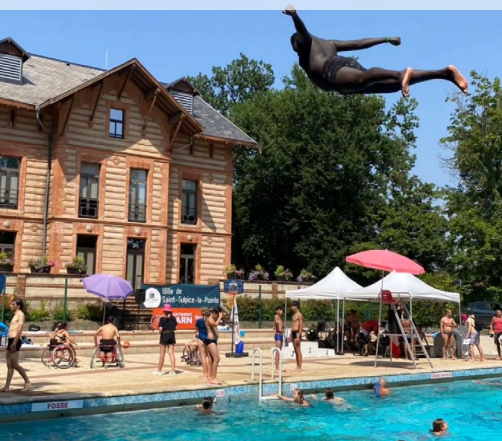
Splash day les 20 et 21 juillet