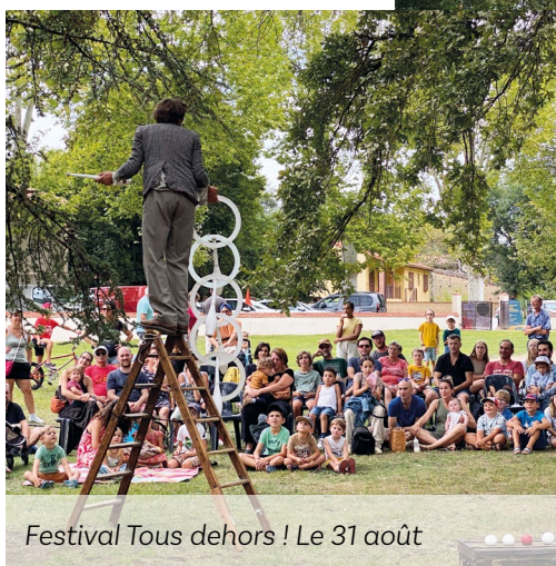
Festival Tous dehors ! Le 31 août