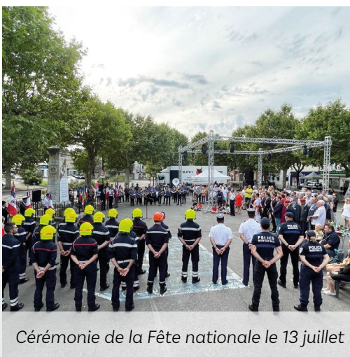
Cérémonie de la Fête nationale le 13 juillet