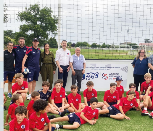
Inauguration du terrain de foot5 le 29 juin

BULLETIN MUNICIPAL SAINT-SULPICE-LA-POINTE Septembre 2024 • Directeur de la publication : Raphaël Bernardin • Photos : Adobe Stock - Freepik - Flaticon - Laurent Ringeval - Emeline Carme - Ville de Saint-Sulpice-la-Pointe • Rédaction : Services municipaux de la Ville • Conception et réalisation : services municipaux de la Ville • Tirage : 4 600 exemplaires