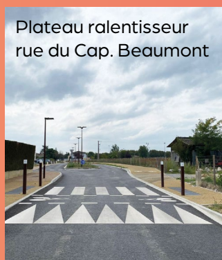
Plateau ralentisseur rue du Cap. Beaumont