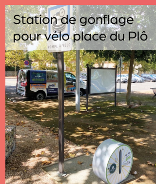
Station de gonflage pour vélo place du Plô