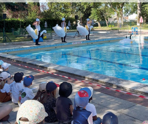
Spectacle de clown aquatique pour les ALAE le 26 juin