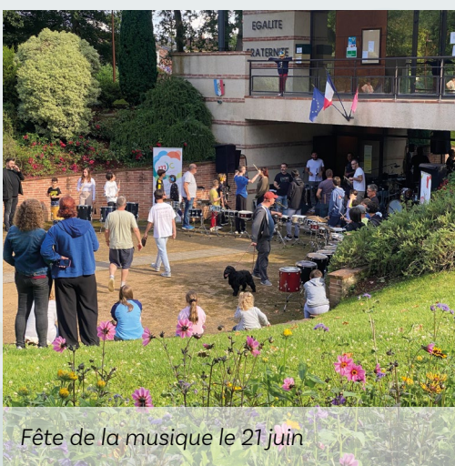
Fête de la musique le 21 juin