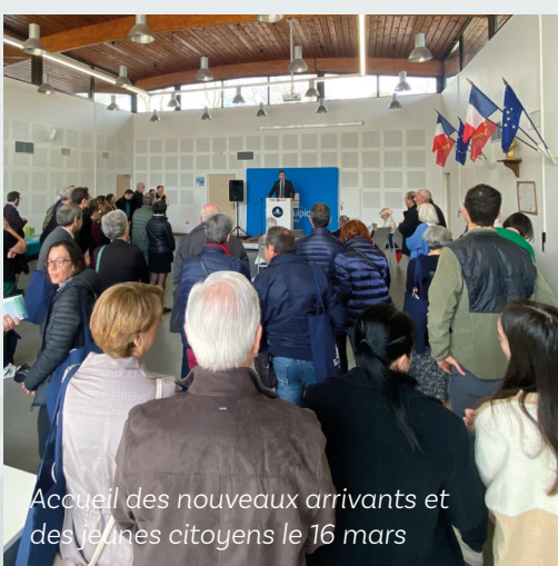
Accueil des nouveaux arrivants et des jeunes citoyens le 16 mars