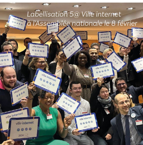
Labellisation 5@ Ville internet à l'Assemblée nationale le 8 février