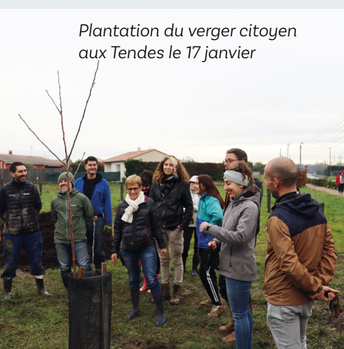
Plantation du verger citoyen aux Tendes le 17 janvier