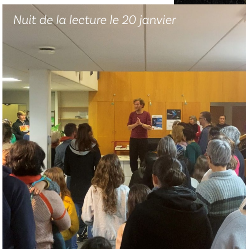
Nuit de la lecture le 20 janvier