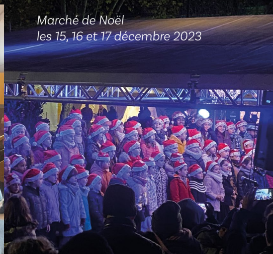
Marché de Noël les 15, 16 et 17 décembre 2023