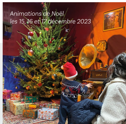
Animations de Noël les 15, 16 et 17 décembre 2023