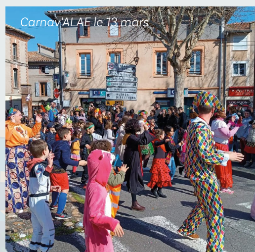
Carnaval ALAE le 13 mars

BULLETIN MUNICIPAL SAINT-SULPICE-LA-POINTE Mars 2024 • Directeur de la publication : Raphaël Bernardin • Photos : Adobe Stock - Freepik - Flaticon - Laurent Ringeval - Emeline Carme - Ville de Saint-Sulpice-la-Pointe • Rédaction : Services municipaux de la Ville • Conception et réalisation : services municipaux de la Ville • Tirage : 4 600 exemplaires