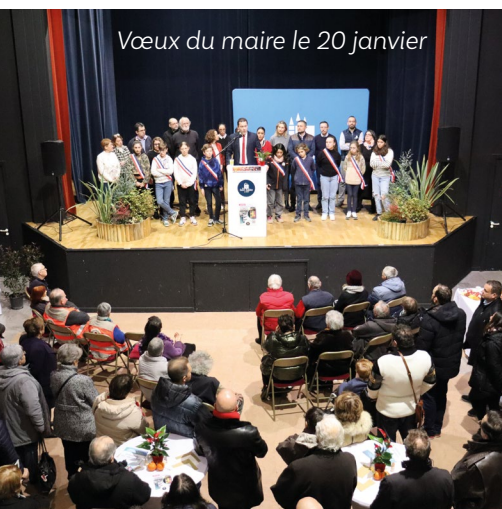
Vœux du maire le 20 janvier