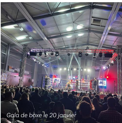
Gala de boxe le 20 janvier