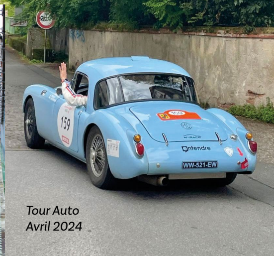
Tour Auto Avril 2024