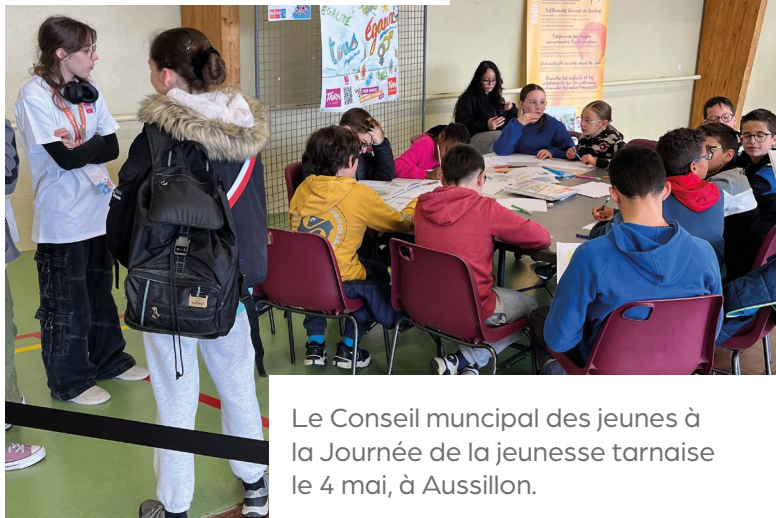
Le Conseil municipal des jeunes à la Journée de la jeunesse tarnaise le 4 mai, à Aussillon.