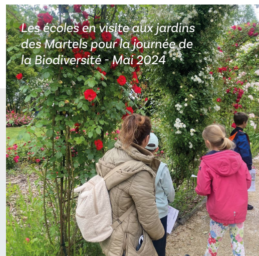
Les écoles en visite aux jardins des Martels pour la journée de la Biodiversité - Mai 2024