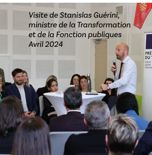
Visite de Stanislas Guérini, ministre de la Transformation et de la Fonction publiques Avril 2024