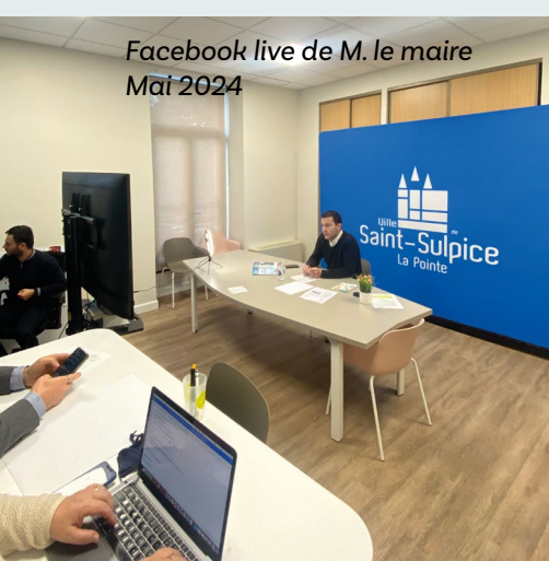
Facebook live de M. le maire Mai 2024