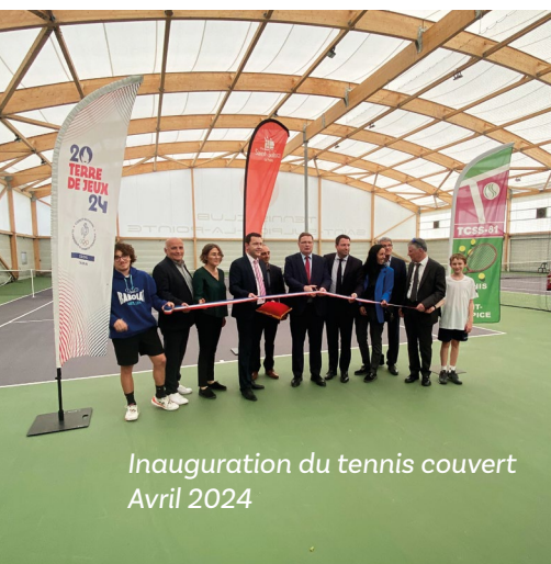
Inauguration du tennis couvert Avril 2024