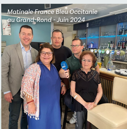
Matinale France Bleu Occitanie au Grand-Rond - Juin 2024