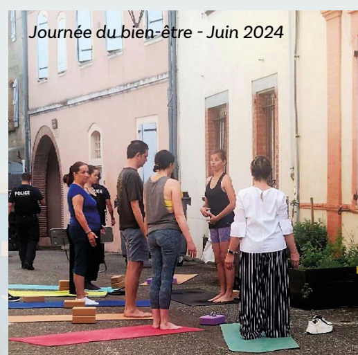
Journée du bien-être - Juin 2024

BULLETIN MUNICIPAL SAINT-SULPICE-LA-POINTE Juin 2024 • Directeur de la publication : Raphaël Bernardin • Rédaction : Services municipaux de la Ville • Conception et réalisation : Service communication de la Ville • Tirage : 4 600 exemplaires sur papier PEFC