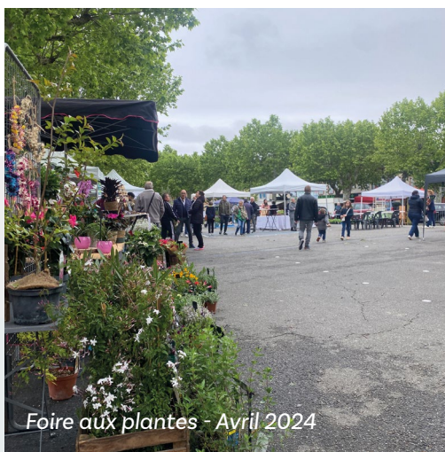
Foire aux plantes - Avril 2024