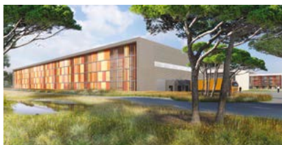
Plateforme Logistique – JMG Partners ©Archigroup Lyon

Nous poursuivons la commercialisation. Nous travaillons à attirer de nouveaux prospects et à sécuriser ceux que nous avons déjà. Il est intéressant de voir que la dominante industrielle du projet vient s'enrichir d'acteurs de l'innovation mais aussi de l'agriculture. Parce que cet espace mixte s'adresse également aux riverains, nous avons mis en place des jardins partagés qui rencontrent un franc succès avec une trentaine de contrats signés. Nous voulons que ce projet d'envergure s'intègre au mieux dans son environnement et qu'il soit synonyme d'activité dans un écosystème agréable.