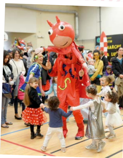
Plus de 500 personnes ont participé à notre carnaval le 6 avril 2019 . Au programme : costumes, bal et exposition de chars réalisés par les enfants de la ville.