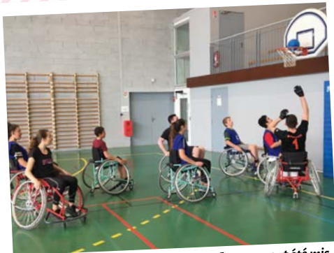
Le 23 avril dernier, les ados de l'Espace Jeunesse ont été mis en situation de handicap le temps d'un échange sportif avec des athlètes handisport. Une prise de conscience concrète des difficultés rencontrées.