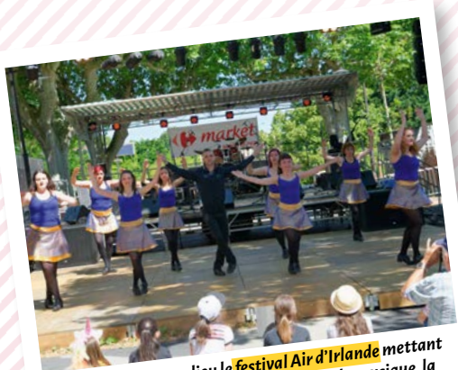
Le 8 juin dernier a eu lieu le festival Air d'Irlande mettant à l'honneur la culture irlandaise à travers la musique, la danse et l'artisanat.

Les derniers mois ont été intenses. Retour en images sur les temps forts qui ont animé notre commune.