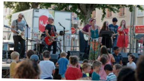
La Fête de la musique 2018 , couplée à la Coupe du Monde de Football et organisée en partenariat avec les associations de la ville, a mis à l'honneur de nombreux groupes de musique.