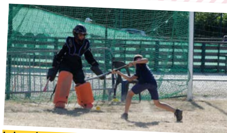
La journée Sport de septembre 2018 a été l'occasion de découvrir une multitude d'activités.