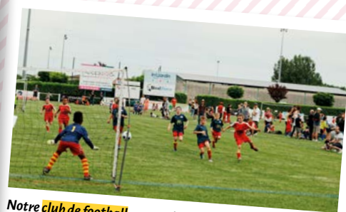
Notre club de football a organisé pendant le week-end de l'Ascension un tournoi regroupant des clubs de la France entière.