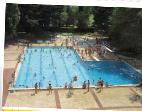
La piscine municipale extérieure vous accueille tout l'été pendant les vacances scolaires. Elle est ouverte 7 jours sur 7 de 10 h 30 à 18 h 45.