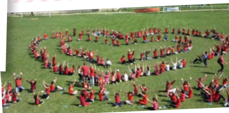
Le 24 mai dernier a eu lieu « Les Parcours du cœur », organisés par la Fédération Française de Cardiologie. Les élèves de CM1 et CM2 ont pu participer à des ateliers sur les bienfaits du sport, le bien manger, les dangers de la cigarette...