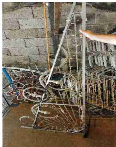
10 Illuminations en triangle pour candélabres