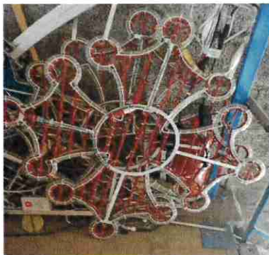
2 croix occitanes en stock