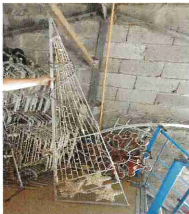
5 illuminations comètes en stock