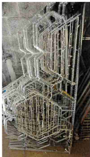
14 illuminations florales