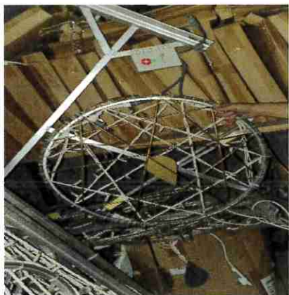
6 attrapes rêves en stock