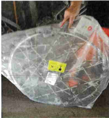
2 attrapes rêves en stock